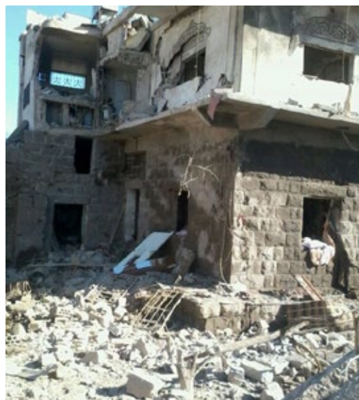
Photo fournie par un interviewé de son logement en ruine, suite à une attaque par bombe barril.

Bien qu'ils aient échappé au conflit, les réfugiés syriens font encore face à d'autres types d'insécurité et à des conditions de vie désastreuses, notamment en raison d'une insécurité financière et de la non-satisfaction de leurs besoins de santé. Plus généralement, les Syriens interviewés ont insisté sur la façon dont l'utilisation d'armes explosives dans les zones peuplées a affecté chaque aspect de leur vie, en accentuant leur vulnérabilité, et en compromettant leur avenir.